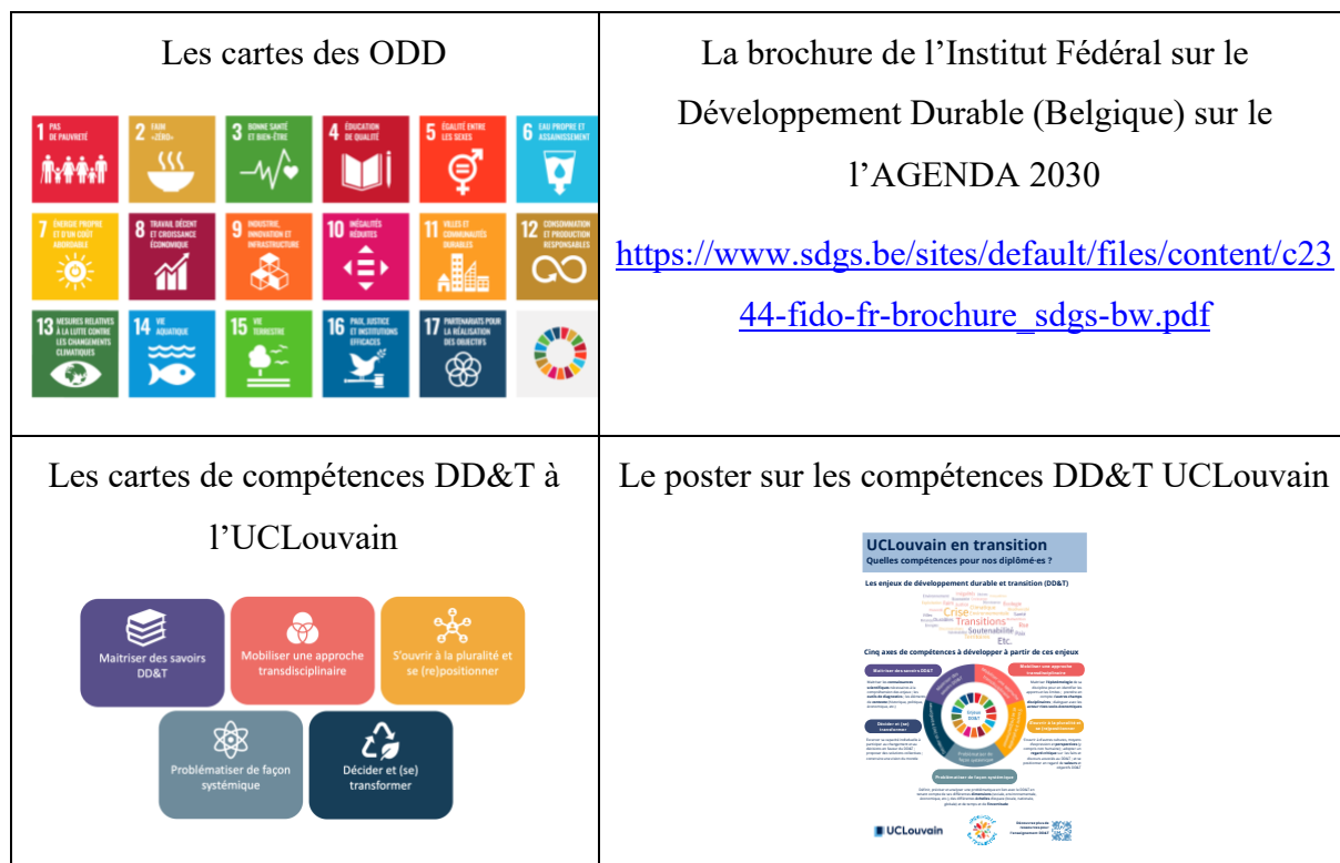
Tableau 1 : quatre ressources pour l'atelier

Nous mobiliserons quatre ressources qui sont soit disponibles gratuitement en ligne, soit reproduisibles dans le contexte local des participant·es. Nous les présentons dans le tableau 1.