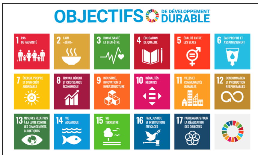
Figure 1 : Représentation schématique des 17 Objectifs de Développement Durable des Nations Unies (ODD)

Les objectifs de Développement Durable (ODD) ont été adoptés en 2015 par les Nations-Unies à travers le programme de développement durable à l'horizon 2030 (Assemblée Générale des Nations Unies, 2015). Les ODD sont présentés sous la forme de 17 objectifs (Éliminer la pauvreté sous toutes ses formes et partout dans le monde ; Prendre d'urgence des mesures pour lutter contre les changements climatiques et leurs répercussions ; etc.) traduits en cibles concrètes (par exemple : « D'ici à 2030, éliminer complètement l'extrême pauvreté dans le monde entier – s'entend actuellement du fait de vivre avec moins de 1,25 dollar par jour ; etc. »). Les ODD sont faciles d'accès pour un public peu initié à ces questions. Ils vont au-delà de la fenêtre exclusivement environnementaliste des enjeux du DD&T en présentant 17 thématiques de réflexion dont le spectre touche potentiellement toutes les disciplines de l'enseignement supérieur. C'est la raison pour laquelle nous souhaitons baser notre atelier sur les ODD comme cadre de référence pour le DD&T.