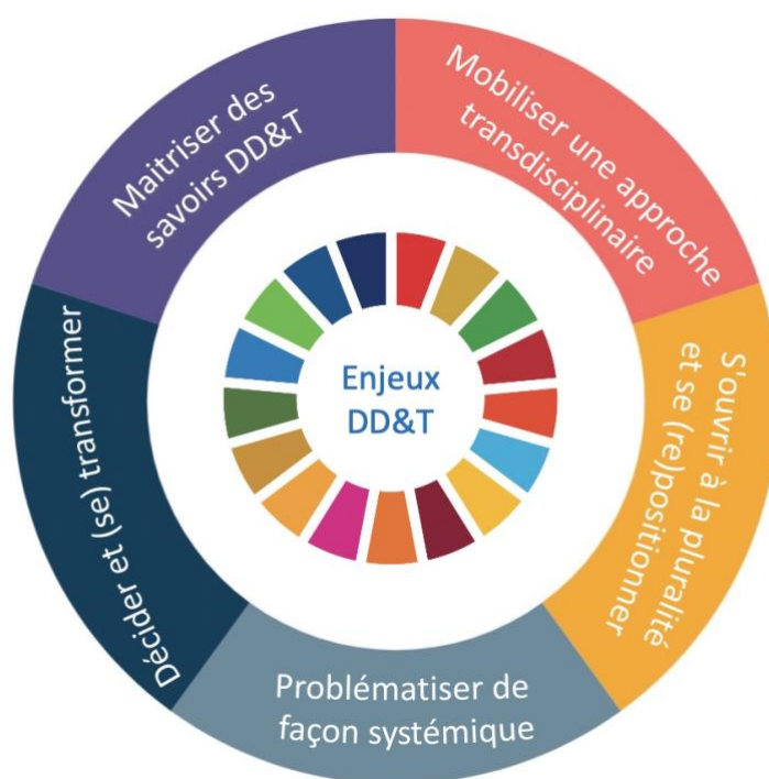
Figure 2 : Représentation schématique du référentiel de compétences DD&T de l'UCLouvain

que l'étudiant·e aura à développer tout au long de son parcours (Prégent et al., 2009). L'UCLouvain a donc choisi les compétences comme approche pour intégrer les enjeux DD&T dans l'ensemble des programmes de bachelier. Afin de guider cette réflexion, nous avons construit un référentiel de compétences DD&T pour l'UCLouvain, sur base de la littérature (Sipos et al., 2008 ; Wiek et al., 2011 ; Renouard et al., 2021, entre autres), de la consultation d'un comité d'expert.es et d'un test de validation par des enseignant.es 3 . Il existe en effet de nombreuses listes de compétences DD&T et, même si certaines tendances s'observent, aucun consensus n'a encore été atteint. Aussi, ces compétences doivent être bien comprises et partagées par les acteur·rices de l'enseignement et ancrées dans un contexte local pour enfin être traduites dans chaque programme.