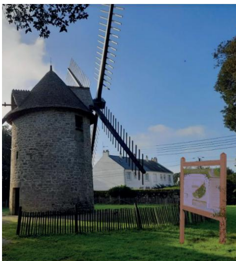
Figure 3. « Le vent complice », station 5 : « Autour du moulin, 5 panneaux implantés [...]. La structure des panneaux doit être discrète et légère, pour ne pas obstruer la vue sur le moulin [...]. Les thématiques seront abordées à l'aide de visuels, de photographies et de textes. » (Extrait du diaporama des étudiants).

Lors de la phase de réalisation du dispositif, les étudiants ont combiné « expérience pensée » et « expérience vécue » pour créer les stations des promenades (figure 3), en prenant en compte l'environnement physique pour implanter les supports de valorisation.