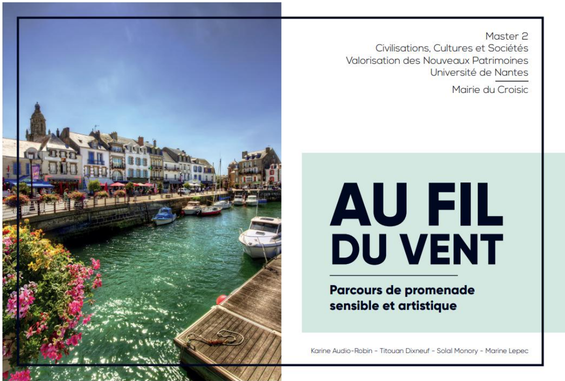
Figure 3. Extrait du diaporama des étudiants pour l'évaluation du projet tutoré et présenté aux élus